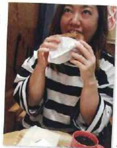
一人カフェバーグルサンド

私が「声を大にして紹介したい!」事、それは... 「一人ご飯のススメ!」元々美味しい物を食べる事が大好きですが、ある日バスが来る迄時間があり、ふらっと一人でも入れそうなお店を探しながら歩いていたのが最初で、それ以来吉野家・焼き肉屋・居酒屋...と、一人ご飯にハマってます。一人ご飯って、自分の好きな時に好きな物を食べられるのがいいですよね! (大勢でワイワイ賑やかに食べる事も好きなんですけど) お勧めはカウンターがあるお店。入りやすいですよ! 最初入る時は緊張しましたが、雰囲気良さそうなお店に思い切っって入ってみると、お店の方から話しかけて頂けたりするので仲良くなれるし、居心地の良いやすらげるお店が発見できて楽しいです。