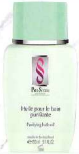
シルエットピュリ ファイングバスオイル 心と身体を清浄化させる