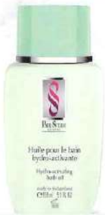
シルエットハイドロ バスオイル 心身をスッキリ軽く整える