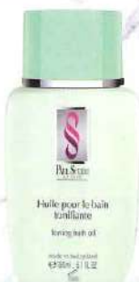
シルエットトーン ングバスオイル 皮膚を引き締める美容効果が高い