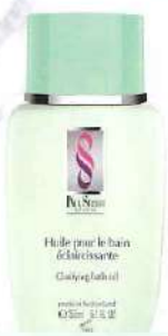
シルエットクラリファイングバスオイル 身体を芯から温めて代謝をアップさせる