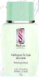
シルエットリラクシングバスオイル 深いリラクゼーションを与える

ハーブのエッセンスを使った スイス生まれのボディケア システムです。ハーブの 持つ有効成分がゆっくりと 皮膚から吸収され、私たちの お肌や身体を、健康で しなやかにする 効果があります☆