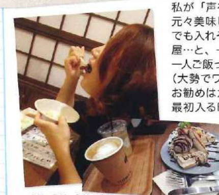
一人じゅうじゅう焼き肉

各店のカレンスタッフが今皆様に「お知らせしたい・紹介したい・見せたい物」等、特に決まりを作らず担当スタッフが思うまま情報発信致します。今回は熊本店 飯島の登場です!